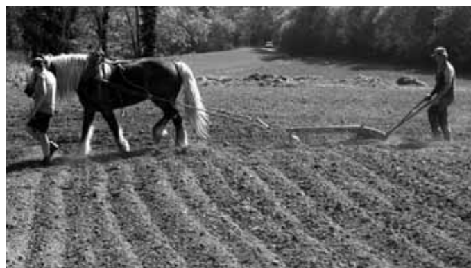
Cheval de trait utilisé pour la plantation, le hersage, le piochage et le buttage des pommes de terre

Constituez maintenant votre «cagette» de légumes de saison sur le site de vente internet.