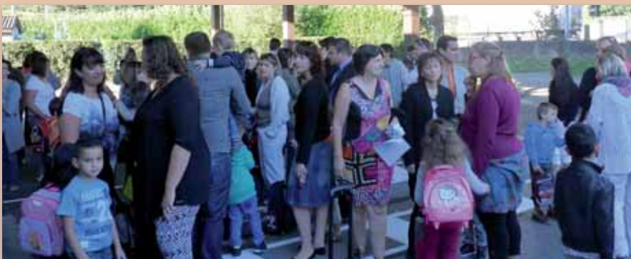
La rentrée à l'école de Boussieu