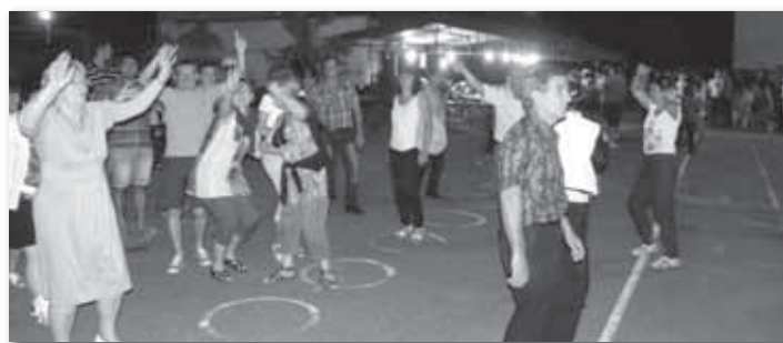
Le bal populaire