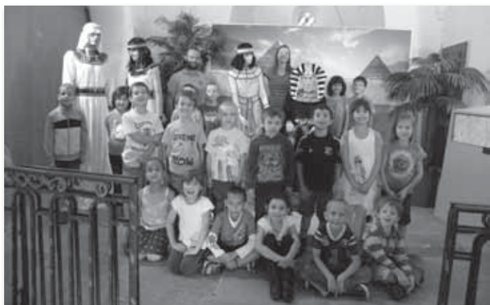
La nuit des églises est une soirée de découverte des églises et des actions culturelles qu'elles

proposent dans le cadre des associations qui font vivre leur patrimoine.