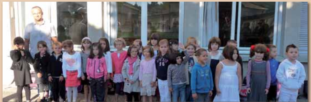
Les CP de Nivolos