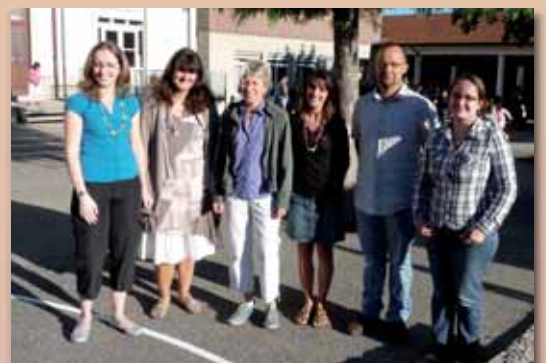
Les enseignants du primaire