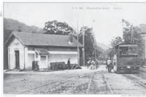
Champier, la gare du tramway