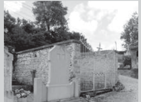
Enclos Martinet côté chemin des Renardières

Sur le cadastre Napoléonien, ce terrain n'est pas mentionné comme cimetière mais comme terre plantée. Le cimetière était peut-être déjà là, mais il n'avait pas d'existence officielle. L'inhumation la plus ancienne connue date de 1846. Ce cimetière d'une superficie de 670 m 2 avait une forme rectangulaire. Il était traversé par une allée centrale allant du portail d'entrée à un enclos qui à l'époque dépassait sur l'extérieur du mur d'enceinte sur le chemin des Renardières. Cet enclos abrite encore de nos jours la tombe Martinet. Cette disposition particulière est due au fait que la famille Martinet avait fait don du terrain sur lequel a été implanté le cimetière. Cette famille comptait parmi les plus gros propriétaires terriens de Nivolas. Cette même famille a également fait don du terrain sur lequel a été construit le presbytère à côté de l'église