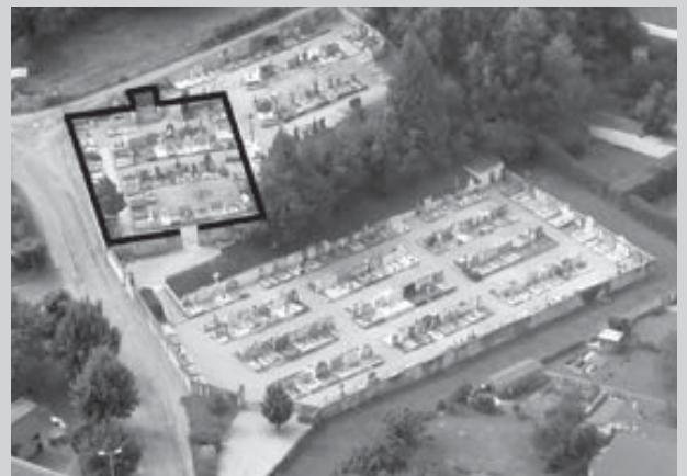
Le premier cimetière