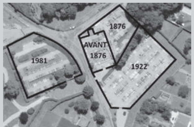
Evolution du cimetière

ries qui doit être digne du métro New-yorkais sous les dalles des parallépipèdes en tôle grise. Elles sont peut-être heureuses quand même ! Peut-être même qu'elles ont muté et ont maintenant le nez plat à force de buter inlassablement sous les dalles !»