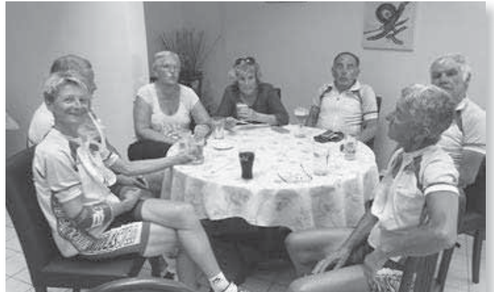
Un bon rafraîchissement à notre arrivée à Montrond les Bains