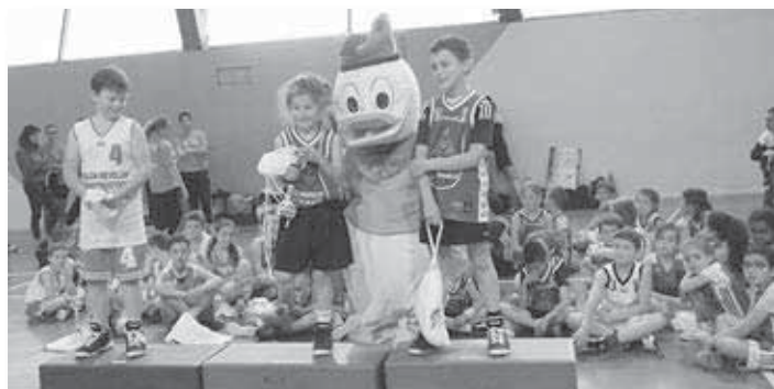
l'adhésion de tous les participants au cours de ce challenge dédié à Myriam Tepelian, une militante du basket, trop tôt disparue.

Dix équipes U9 et U11 de cinq clubs avaient répondu présents et à côté du tournoi de basket, de nombreuses activités étaient proposées : parcours, coloriage, maquillage et le fil rouge qui n'était autre que de comptabiliser le plus de paniers possible. L'équipe des U11 de Four-Artas a montré incontestablement une belle maîtrise, tant en individuel qu'en équipe. Une matinée festive qui a emporté