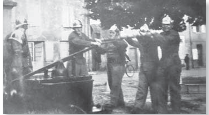
Manœuvre sur la Place de Nivolas Années 30

Ce type de pompe aspirante/ refulante permet de mettre en action une lance à incendie dont l'efficacité est inversement proportionnelle à la fatigue des