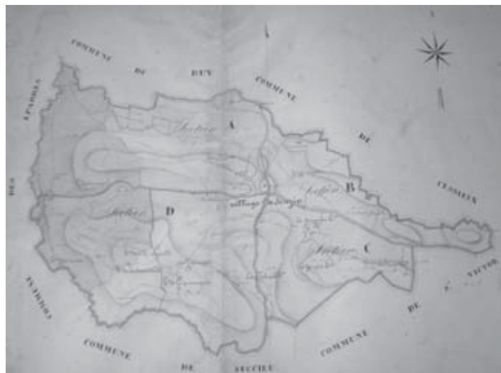
Sérézin en 1832. En sombre la partie détachée pour former la commune de Nivolas-Vermelle