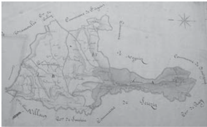
Les Eparres en 1832. En sombre la partie détachée pour former la commune de Nivolas-Vermelle