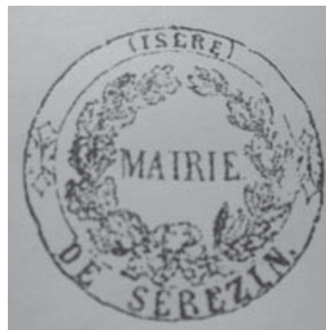
Ancien sceau de Sérézin